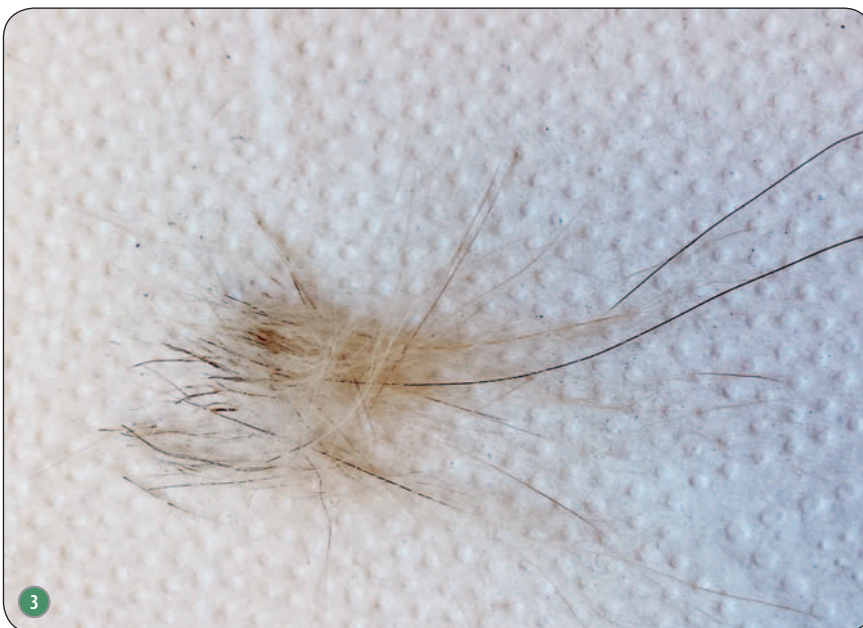
Ryc. 1. Przerzedzenie włosów, suchość skóry z hiperpigmentacją i obecnością łusek u dwuletniego psa rasy akita; Ryc. 2. Zmiany u psa z ryc. 1 po czterech tygodniach stosowania kąpeli w szamponie zawierającym dwusiarczek selenu; Ryc. 3. Włosy 6-letniego psa rasy akita. Widoczne typowe dla łojotoków pierwotnych odlewy mieszkowe