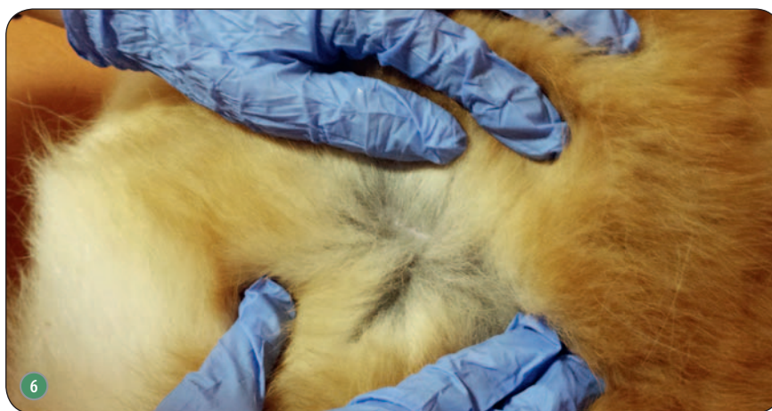
Ryc. 4. Matowość włosa oraz suche łuski na grzbiecie psa rasy berneński pies pasterski z sebaceous adenitis ; Ryc. 5. Pies z ryc. 4 po miesięcznej szamponoterapii szamponem z dwusiarczkiem selenu; Ryc. 6. Młody akita, u którego rozpoznano sebaceous adenitis . Na zdjęciu początek zmian