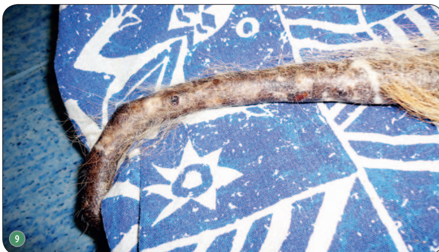
Ryc. 7. Powiększenia sebaceous adenitis w postaci powierzchownego ropnego zapalenia skóry. Zmiany przebiegają ze świądem; Ryc. 8. Przewlekłe stadium sebaceous adenitis u 7-letniego psa rasy akita. Widoczne strupy na zewnętrznej stronie małżowin usznych (typowa lokalizacja); Ryc. 9. Bezwłosy ogon u psa z ryc. 8

► opcją terapeutyczną w leczeniu sebaceous adenitis u psów. Większość właścicieli uznała, że powtarzane aplikacje szamponu były skuteczne i dobrze tolerowane. Przeprowadzone badanie terenowe dowodzi, że szampon zawierający dwusiarczek seleny jest produktem, który może być stosowany w leczeniu sebaceous adenitis oraz jego powikłań bakteryjnych. Należy jednak przeprowadzić dodatkowe badania porównawcze w celu lepszego zdefiniowania odpowiedzi terapeutycznej w przypadku tej choroby. □